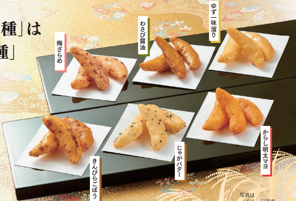
写真は イメージです。

直営店 心齋橋法善寺あられ 〒542-0081 大阪市中央区南船場3丁目6番16号 TEL (06) 6245-1258(代) FAX (06) 6245-1258